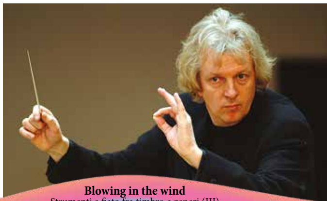
Blowing in the wind Strumenti a fiato fra timbro e generi (III)

Domenica 12 maggio - Carpi, Auditorium San Rocco - ore 21