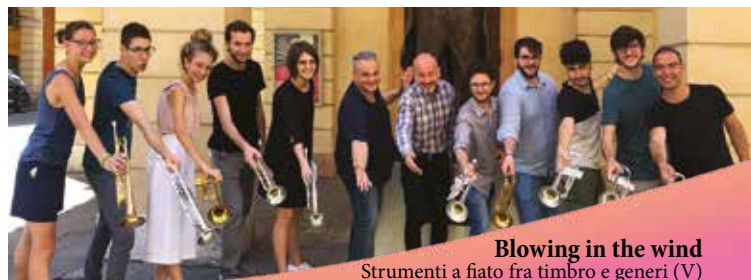
Blowing in the wind Strumenti a fiato fra timbro e generi (V)